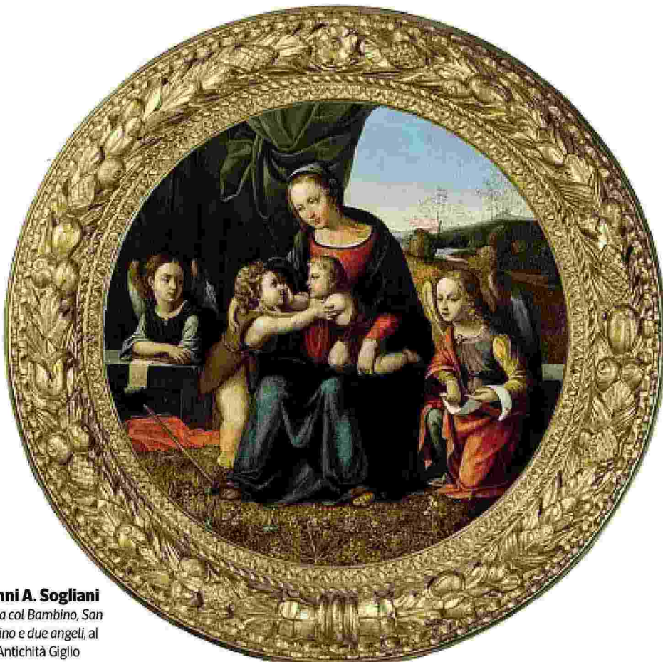
Giovanni A. Sogliani Madonna col Bambino, San Giovannino e due angeli, al Biaf, da Antichità Giglio

Ritaglio stampa ad uso esclusivo del destinatario, non riproducibile.