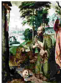
Ambrosius Benson San Girolamo in Preghiera , olio su tavola, cm77x59, presentata alla Biaf di Firenze da Caretto & Occhinegro. Cifra richiesta: 150 mila euro